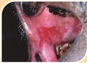
කල් පවතින රතු ලප