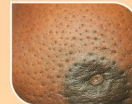
දොඩම් ලෙල්ලක මතුපිට වැනි සමේ වෙනස්වීමක්, සම මතුපිට දදයක්/ තුවාලයක්