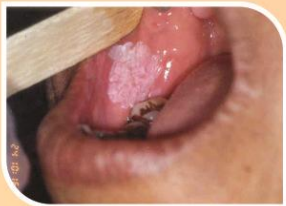
කල් පවතින සුදු ලප