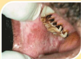
කාලයක් පවතින සුව නොවන තුවාලයක්

මුඛයේ අසාමාන්‍ය දැවිල්ලක් සමඟ තොල් සහ ශ්ලේෂ්මලයේ සහ විමක් සහ සුදුමැළි විමක්