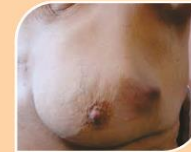
පියයුරුවල ගැටිත්තක් හෝ ඉදුම්මක්