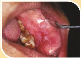
කල් පවතින සුදු සහ රතු මිශ්‍ර ලප

මුඛයේ අසාමාන්‍ය දැවිල්ලක් සමඟ තොල් සහ ශ්ලේෂ්මලයේ සහ විමක් සහ සුදුමැළි විමක්